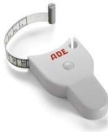
CINTA METRICA PARA PERIMETROS